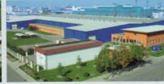
Hörmann Beijing, China