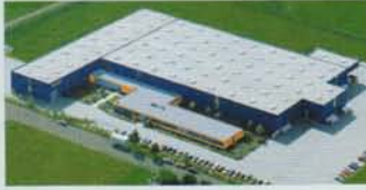
Hörmann KG Dissen