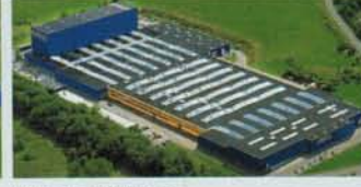
Hörmann KG Freisen