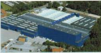
Hörmann KG Amshausen