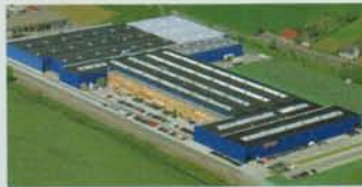
Hörmann KG Werne