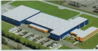
Hörmann KG Antriebstechnik