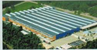
Hörmann Genk NV, Belgien