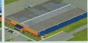
Hörmann Gadco LLC, Vonore TN, USA

Als einziger Hersteller auf dem internationalen Markt bietet die Hörmann-Gruppe alle wichtigen Bauelemente aus einer Hand. Sie werden in hochspezialisierten Werken nach dem neuesten Stand der Technik gefertigt. Durch das flächendeckende Vertriebs- und Servicenetz in Europa und die Präsenz in Amerika und China ist Hörmann Ihr starker, internationaler Partner für hochwertige Bauelemente. In einer Qualität ohne Kompromisse.