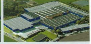
Hörmann KG Brockhagen