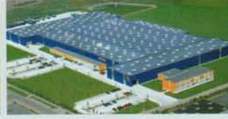
Hörmann KG Brandis