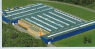
Hörmann KG Eckelhausen