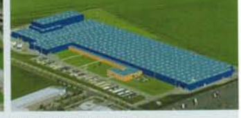
Hörmann KG Ichttershausen